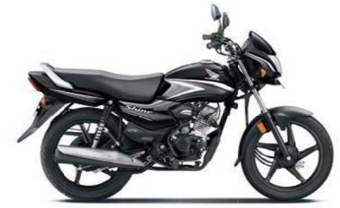
ग्रे के साथ ब्लैक

अभी ऑनलाइन बुक करें! www.honda2wheelerindia.com