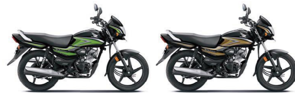
ग्रीन के साथ ब्लैक गोल्ड के साथ ब्लैक